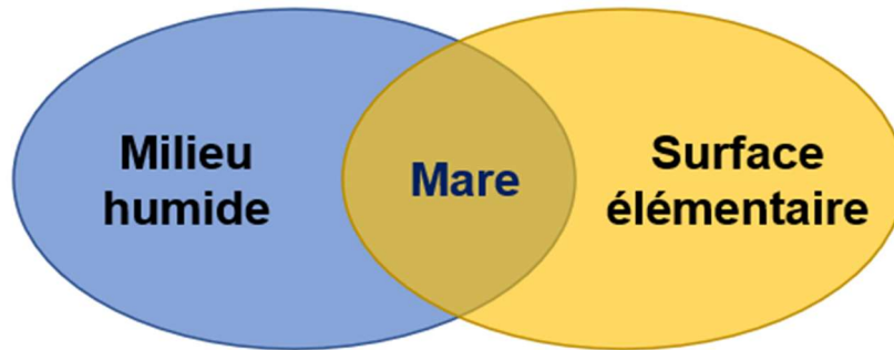
Figure 3 : illustration de la superposition conceptuelle

Concernant la représentation géométrique, le débat porte sur le choix entre une représentation surfacique (polygone) et une représentation ponctuelle (point). La représentation ponctuelle est privilégiée à ce stade, afin d'éviter les problèmes de superposition de couches avec les milieux humides et les plans d'eau, qui sont déjà représentés sous forme de polygones. La possibilité d'intégrer ultérieurement des informations de surface (classes ou fourchettes) est toutefois évoquée. La représentation ponctuelle renforce l'argument en faveur de la création d'un référentiel dédié, étant donné que les milieux humides et les plans d'eau sont représentés par des éléments surfaciques.